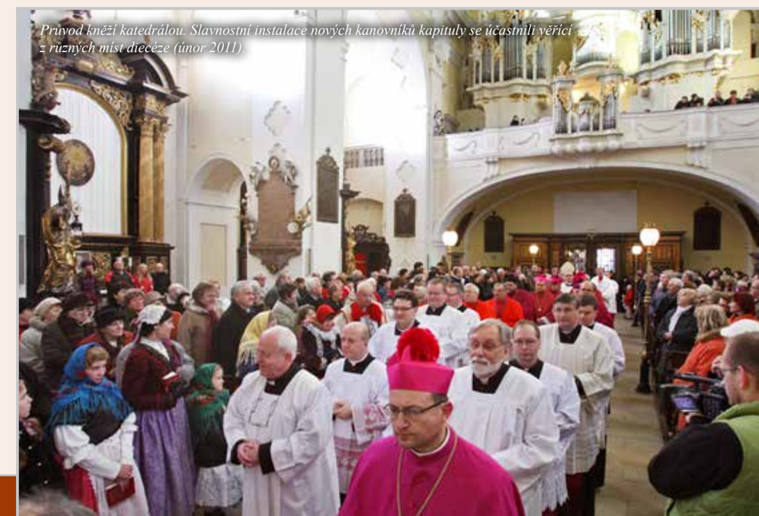
Průvod kněží katedrálou. Slavnostní instalace nových kanovníků kapituly se účastnili věřící z různých míst diecéze (únor 2011).