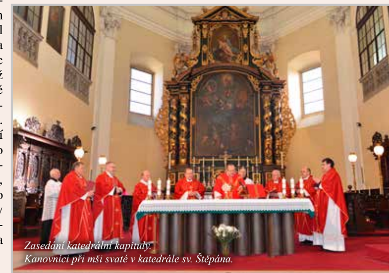
Zasedání katedrální kapituly. Kanovníci při mši svaté v katedrále sv. Štěpána.

Se vznikem biskupství se rovněž změnilo postavení kapituly – stala se katedrální, neměla již v čele probošta a mezi hlavní úkoly kanovníků od této doby patřila především pomoc