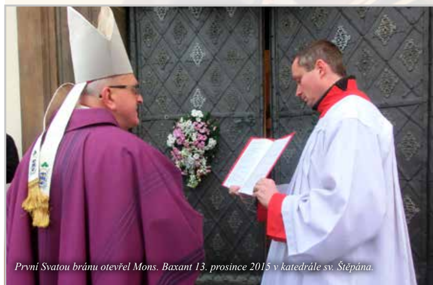
První Svatou bránu otevřel Mons. Baxant 13. prosince 2015 v katedrále sv. Štěpána.