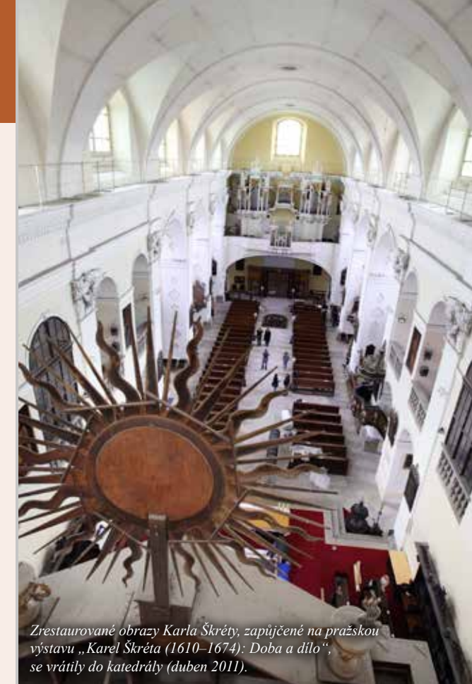
Zrestaurované obrazy Karla Škréty; zapůjčené na pražskou výstavu „Karel Škréta (1610–1674): Doba a dílo“, se vrátily do katedrály (duben 2011).

Kapitula působí na tomto místě již od roku 1057, nejdříve jako kolegiální, od roku 1655 jako katedrální, a je tedy úzce spojena s tímto místem. Katedrála je biskupským kostelem, ale po stránce