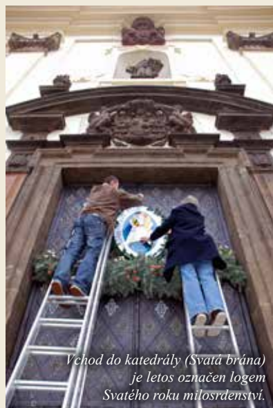
Vchod do katedrály (Svatá brána) je letos označen logem Svatého roku milosrdenství.

Každý hřích, i když je nám odpuštěn, neboť je to porušení Božího řádu, s sebou nese tzv. tresty, které si musíme vytrpět teď zde na Zemi nebo v očistci. Ten, kdo získá odpušky, čerpá z pokladů církve, tj. z oběti Ježíše Krista na kříži a také ze zásluh mučedníků a světců. Těm, kdo splní dané podmínky, jak jsem již uvedl, uděluje církev odpuštění těchto trestů. Nejde tedy o odpuštění hříchů, ale pouze o odpuštění trestu za hříchy. Hříchy se odpouštějí rozhřešením ve svátosti pokání, které musí být spojeno s upřímnou lítostí s úmyslem více nehrěšit a vykonat uložené pokání.