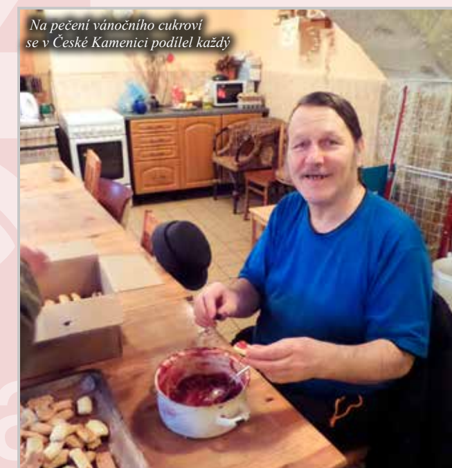
Na pečení vánočního cukroví se v České Kamenici podílel každý