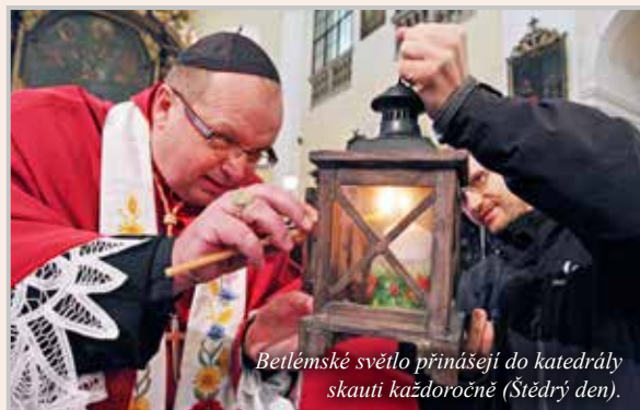
Betlémské světlo přináší do katedrály skauti každoročně (Štědrý den).

Je členem Rytířského řádu Křížovníků s červenou hvězdou, kde je komendátorem (komturem), generálním prokurátorem řádu a magistrem kleriků a noviců. Je členem Vojenského špitálního řádu sv. Lazara Jeruzalémského (s titulem kaplan-senior) a členem Liturgické komise při České biskupské konferenci. Je soudním znalcem v oboru sakrálního umění.