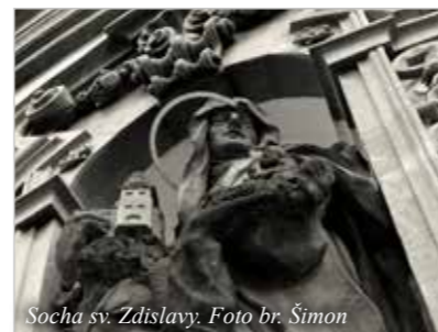
Socha sv. Zdislavy.

želské vraždění francouzského dramatika Erica Emmanuela Schmitta. Roli manželského páru představovaly tři skutečné manželské páry. Divadlo bří v hábitu s touto inscenací vystupovalo na festivalu místních divadel na Hostýně. Soubor také realizuje projekty pro děti a dospělé a také spolupracuje přes hranice