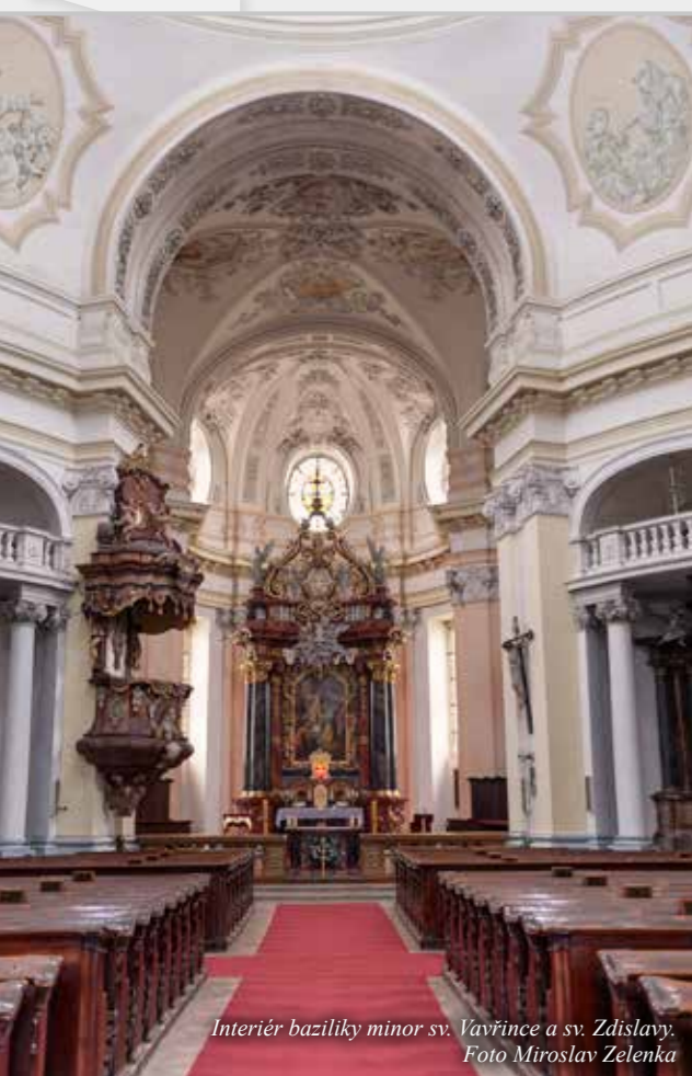
Interiér baziliky minor sv. Vavřince a sv. Zdislavy.