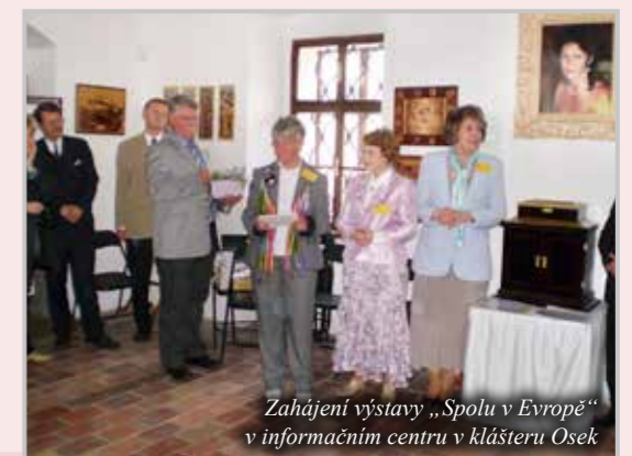
Zahájení výstavy „Spolu v Evropě“ v informačním centru v klášteře Osek