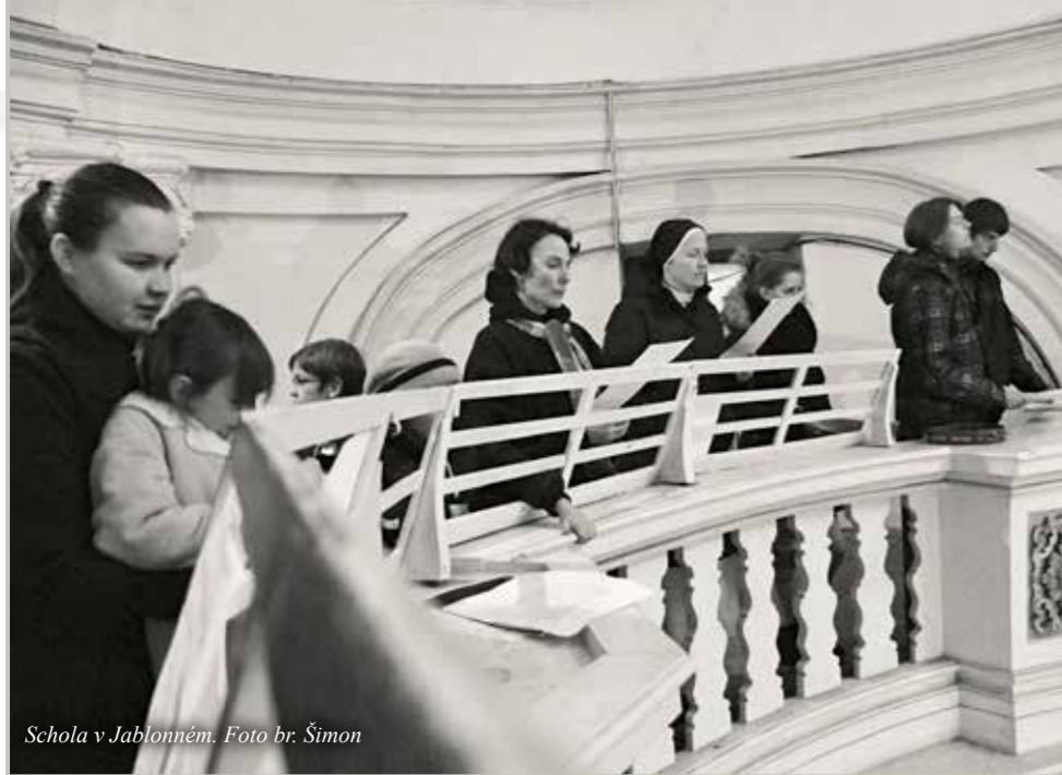
Schola v Jablonném.

souboru přímo na míru komponuje hudbu. Manželé Spalovi jsou i organizátory farního divadla a zdejší scholy a scholky.