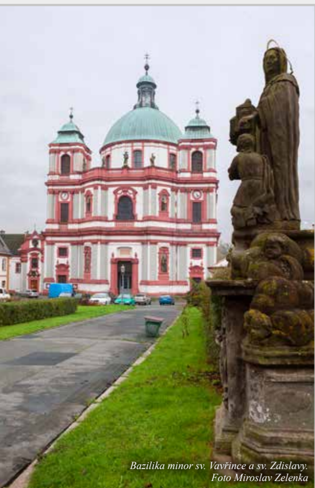
Bazilika minor sv. Vavřince a sv. Zdislavy.

nost, měl jsem farnost v Trmicích po arcibiskupu Karlu Otčenáškově, zažil jsem tam opravdu živé společenství. Potom jsem byl převelen do Plzně, to byla také krásná služba. S roční přestávkou v Praze jsem jedenáct let působil v Olomouci jako novicmistr. V klášteře nás tehdy bylo asi dvánáct. Před rokem a půl jsem přišel sem do Jablonného ke hrobu svatě Zdislavy, která se jako terciářka dominikánského řádu stala patronkou českých dominikánů.