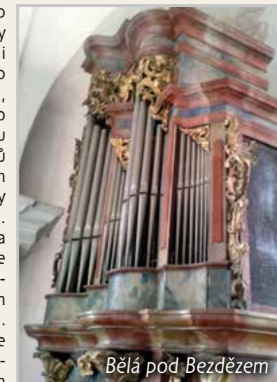
Bělá pod Bezdězem

váděny. Tyto varhany byly v minulosti velmi málo používány, kostel byl po předání řádu augustiniánů trvale uzavřen a prakticky nevyužíván. Přesto se to na stavu nástroje nějakým fatálním způsobem neprojevovalo. Varhany se vyznačují velmi příjemným zvukem a chodem traktury a zahrát si na ně je potěšením.