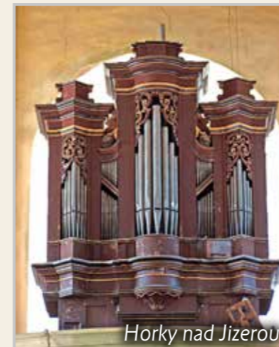
Horky nad Jizerou

Příprava jednotlivých akcí v rámci tohoto projektu je někdy náročná a někdy i dost významné změny časů nebo i termínů probíhají na poslední chvíli, kdy na ně je již velmi obtížné reagovat. Doufáme, že letos se těmto nepříjemným situacím vyhneme. Zatím tedy můžeme odpovědně předběžně oznámit následující akce (jde o první, takzvanou jarní řadu):