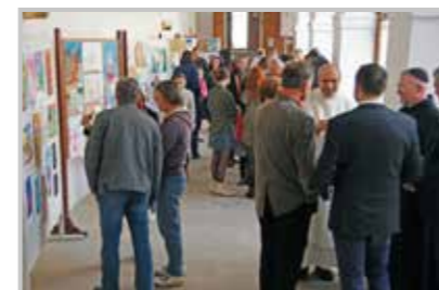
Hosté na vernisáži.

V Jablonném v Podještědí byla v neděli 1. května 2016 zahájena letošní poutní sezona poutí dětí k paní Zdislavě. Po mši svaté, kterou slou-