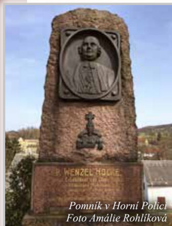
Pomník v Horní Polici