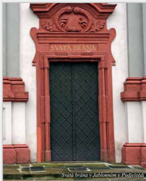
Svatá brána v Jablonném v Podještědí

Ptala se Zuzana Adamová Foto bez označení autora: autorka textu