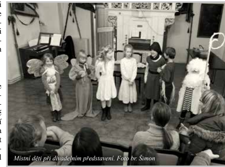
Místní děti při divadelním představení.