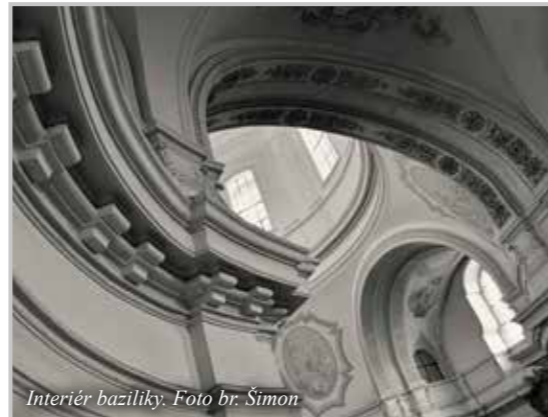
Interiér baziliky.

Při Centru svaté Zdislavy bylo založeno také farní divadlo. Na zkouškách, které probíhají jednou týdně, se schází asi osm dospělých a děti. Dospělí nastudovali například Man-