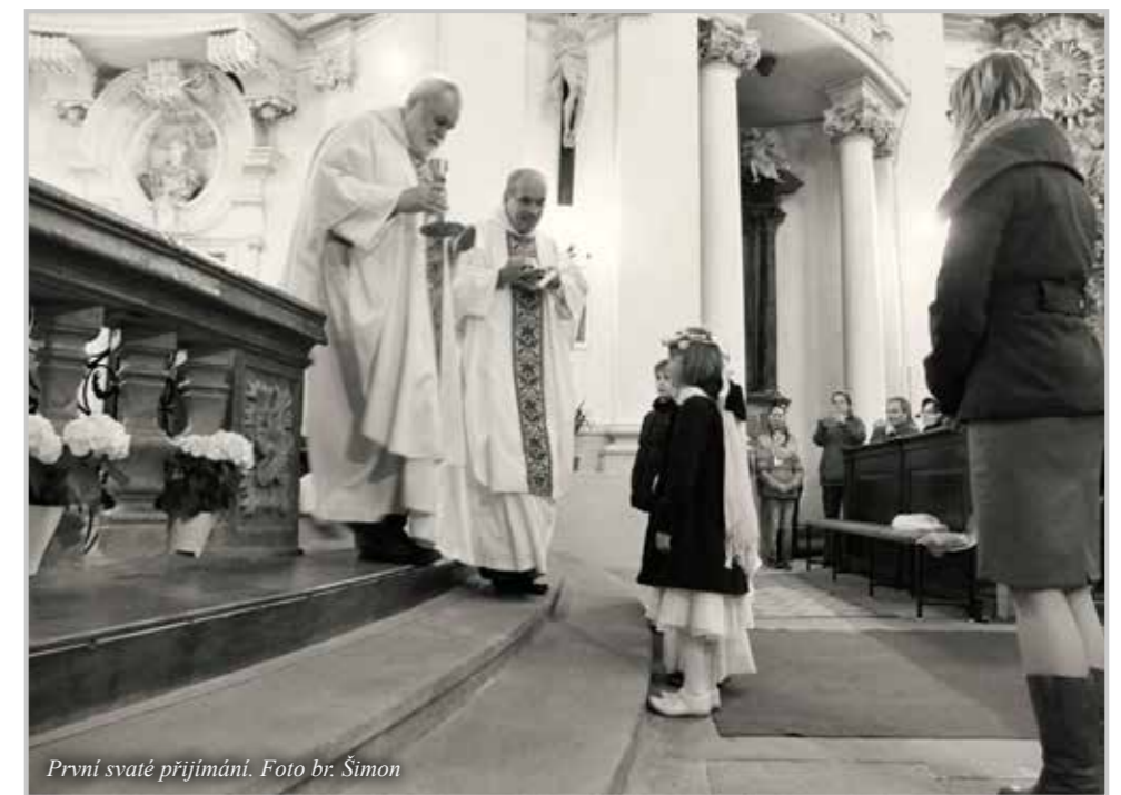
První svatě přijímání.