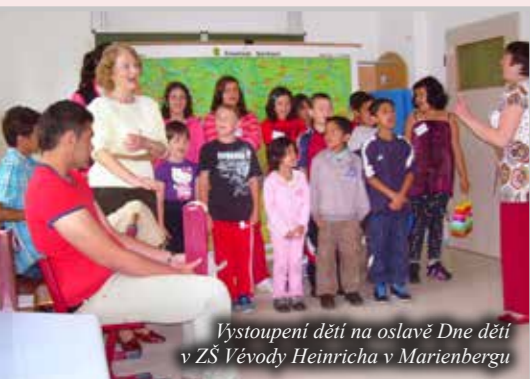
Vystoupení dětí na oslavě Dne dětí v ZŠ Vévody Heinricha v Marienbergu