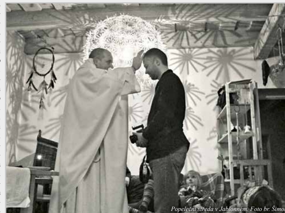
Popeleční středa v Jablonném.

Do řádu jsem vstoupil v roce 1986. Byla mi prominuta kandidatura, jel jsem na exercicie a na svatého Václava jsem měl obláčku v jednom tajném řeholním domě v Praze-Lysolajích.