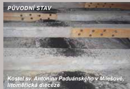
PŮVODNÍ STAV Kostel sv. Antonína Paduánského v Milešově, litoměřická diecéze