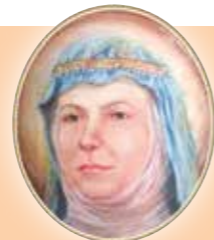
SV. ZDISLAVA Z LEMBERKA

Římskokatolická farnost Jítava E-mail: farnostjitrava@seznam.cz FARA JÍTRAVA, Jítava, čp. 98, 463 55, RYNOLTICE www.farajitrava.cz www.facebook.com/farajitrava