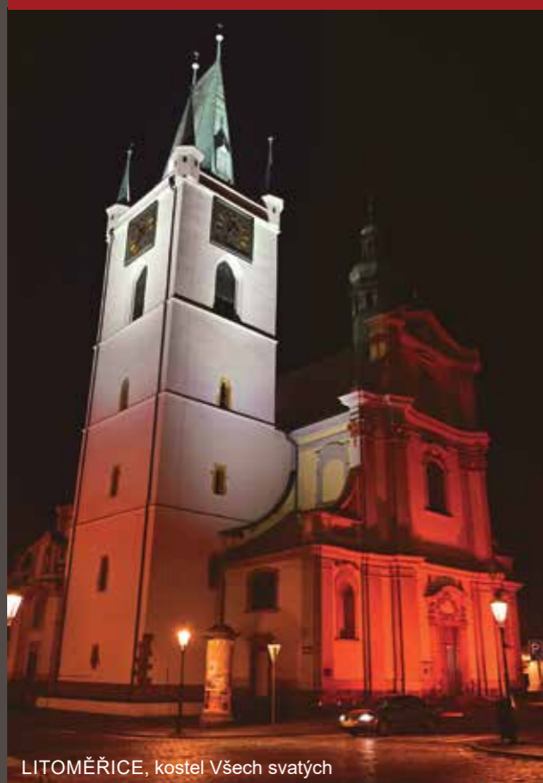
LITOMĚŘICE, kostel Všech svatých