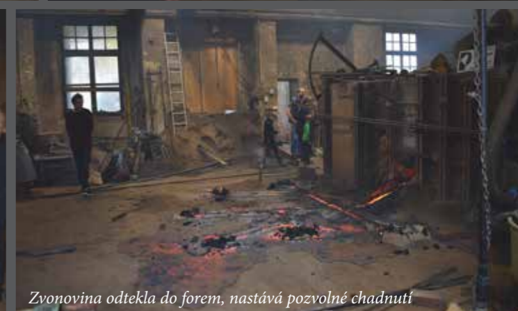
Zvonovina otekla do forem, nastává pozvolné chladnutí