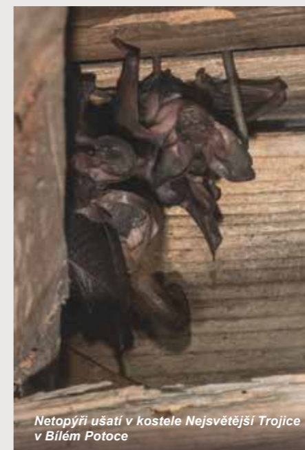
Netopýři ušatí v kostele Nejsvětější Trojice v Bílém Potoce