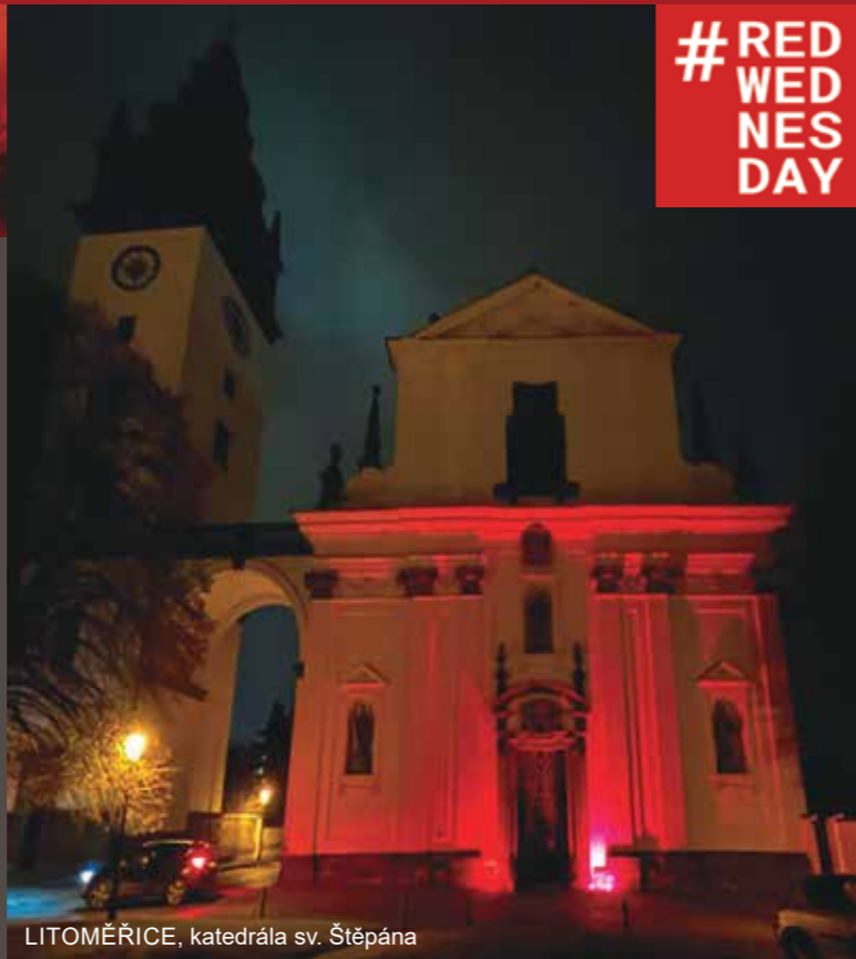
LITOMĚŘICE, katedrála sv. Štěpána