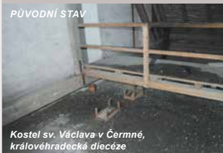
PŮVODNÍ STAV Kostel sv. Václava v Čermné, královéhradecká diecéze