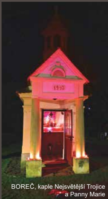
BOREČ, kaple Nejsvětější Trojice a Panny Marie