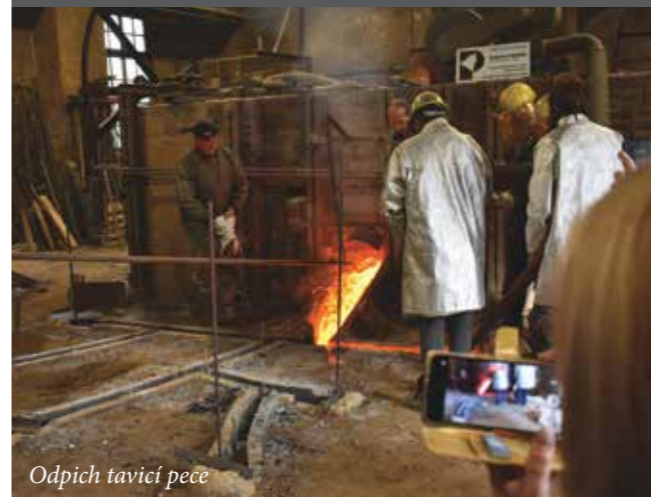
Odpich tavící pece