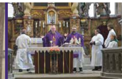
Zádušní mše sv. v kostele sv. Petra a Pavla na Mělníku