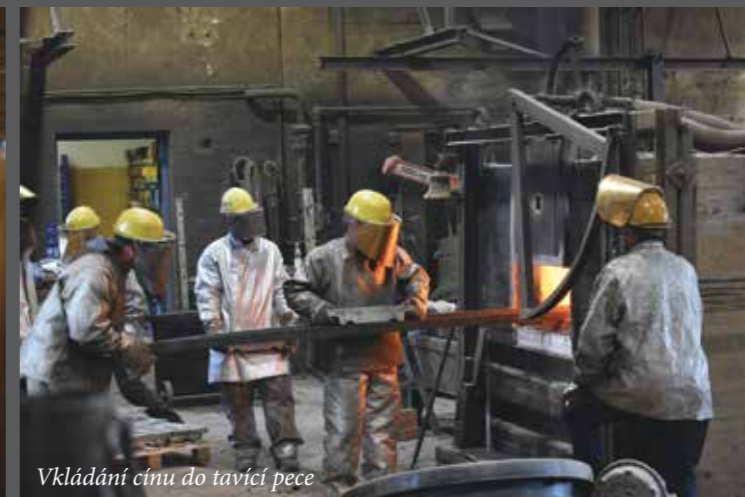
Vkládání cínu do tavící pece