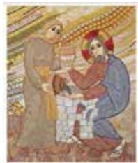
DIREKTORIUM PRO KATECHEZI

Katecheze není jen předáváním teoretických znalostí, ale uváděním na cestu víry a doprovázením člověka na této cestě. Vhodně zvolenou katechezí osobní víra v Ježíše Krista zmršťovává a roste a zraje ve společenství církve. Plodem katecheze je pak nejen živá víra, ale i vnitřně svobodné jednání, samostatné myšlení a schopnost rozlišit pravdu od toho, co nás může klamat. Dokument se zabývá katechezí v evangelizačním poslání církve, obšírně se věnuje osobnosti katechety a zdůrazňuje, že právě katecheté jsou často prvními svědky víry a hlasateli Božího slova. Direktorium popisuje různé metody a styly katecheze a dodává cenné postřehy o katechezi v konkrétních situacích – zejména v prostředí rodin, škol a farností, ale i mezi lidmi na okraji společnosti. Detailně se zabývá katechezí na místní i diecézní úrovni a všimá si i řady dalších otázek, jako jsou šance a úskalí digitální éry, výchova ke spravedlnosti, ekumenismus, mezináboženský dialog a jiné.