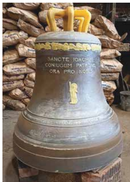
Model zvonu sv. Jáchym

Pak už jenom nejen pracovníci dílny, ale i všichni přihlízející sledovali, jak roztavená zvonovina protéká připravenými kanálky a plní jednotlivé zvonové formy. Slavnostní chvíli si mnozí přihlízející samozřejmě fotografovali, aby tento slavnostní okamžik mohl být uložen do kronik a archivů. Z Jedlky přijelo na tuto historickou chvíli osm farníků, z Prysku dva.