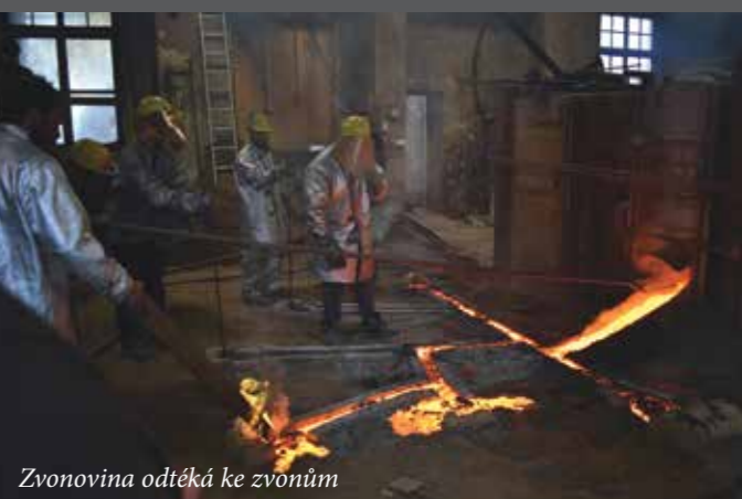
Zvonovina odtéká ke zvonům