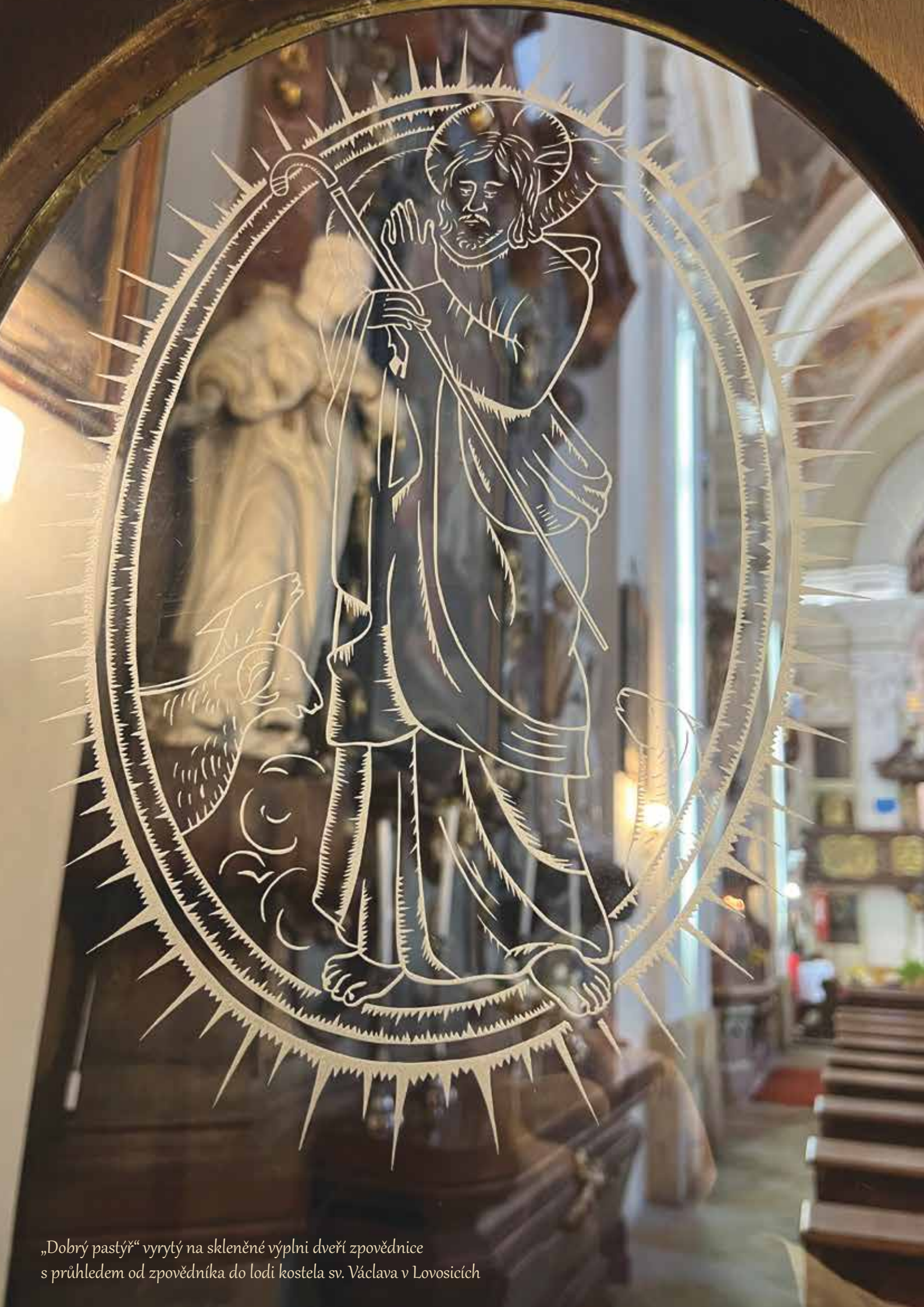
„Dobrý pastýř“ vyrytý na skleněné výplni dveří zpovědnice s průhledem od zpovědníka do lodi kostela sv. Václava v Lovosicích