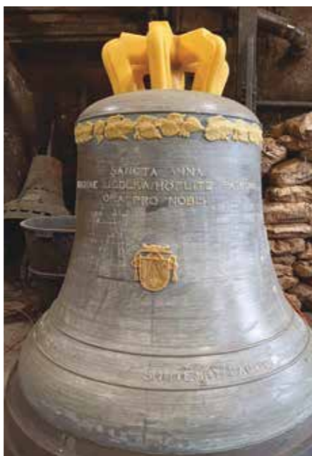
Model zvonu sv. Anna

V tento den bylo ovšem odlito více zvonů, nejen pro dva kostely naší litoměřické diecéze, Jedlku a Horní Prysk, ale také dva velké zvony pro kostel sv. Vavřince v Přerově v olomoucké arcidiecézi. Jak jsme se na místě dozvěděli, přerovské zvony, z nichž jeden má mít