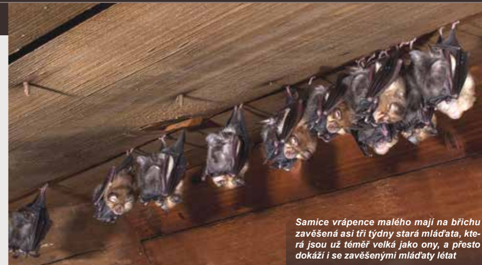
Samice vrápence malého mají na břichu zavěšená asi tři týdny stará mláďata, která jsou už téměř velká jako ony, a přesto dokáží i se zavěšenými mláďaty létat

I přes příkladnou péči a mnohá z Boží prozřetelnosti prozíravá opatření, jako je třeba rozložení porodu do delšího časového období, aby při případné letní nepřízni počasí nebyla v raném věku vystavena celá generace život ohrožujícím podmínkám, se jednoho roku života dožívá pouze 20 až 30 % jedinců. Ano, velké množství slabších mlá-