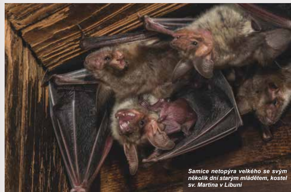
Samice netopýra velkého se svým několik dní starým mláďetem, kostel sv. Martina v Libuni

Nejvíce nápadným znakem přítomnosti netopýřů jsou různé velké hromady netopýřích trusu. Ten je